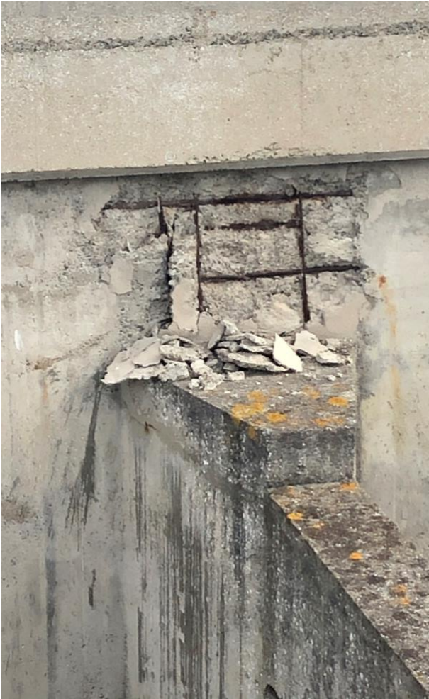
Rapport #1 février 2021