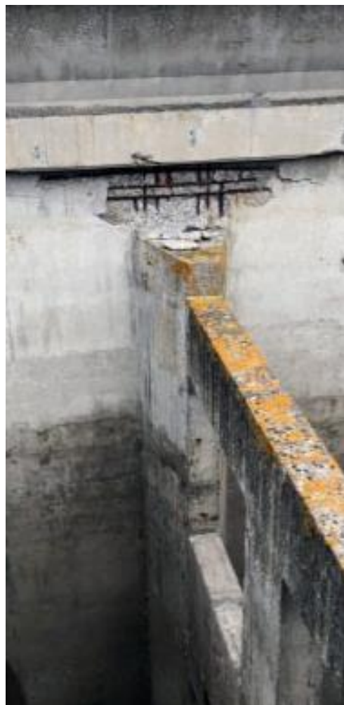
Rapport #2 octobre 2021