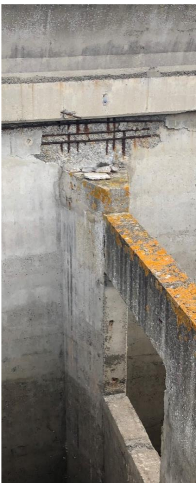
Rapport #1 février 2021