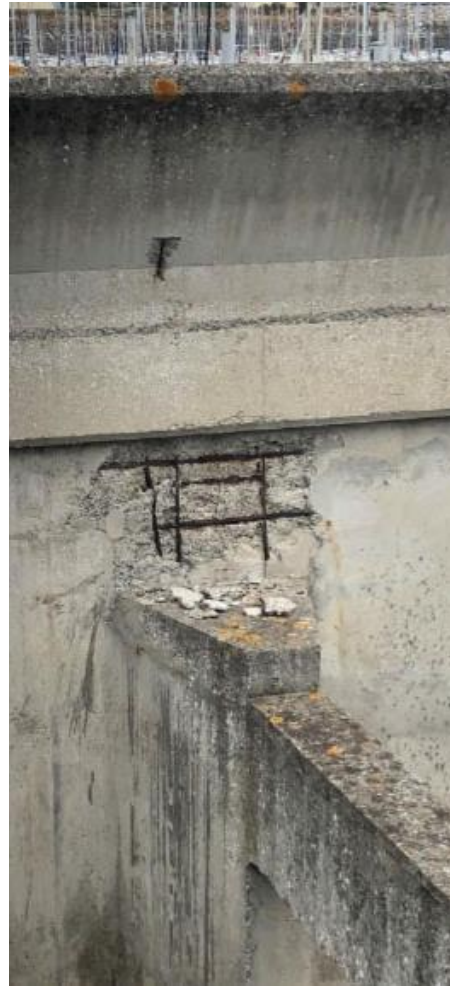
Rapport #2 octobre 2021