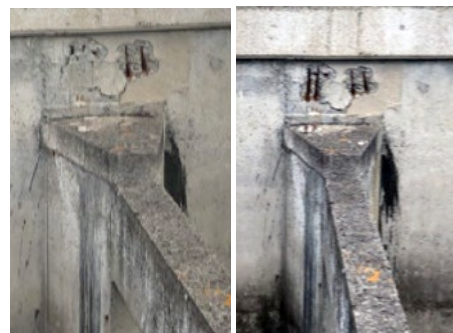
À gauche, état en juin 2020, à droite, en septembre 2021.