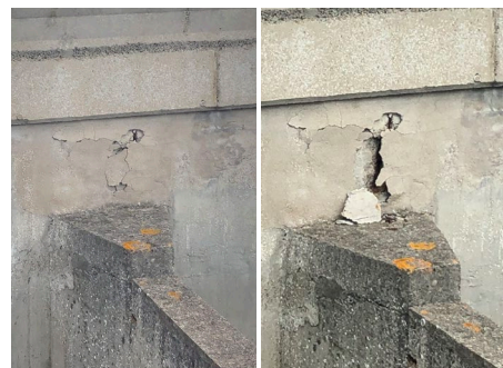
À gauche, état en septembre 2020, à droite, en avril 2021.