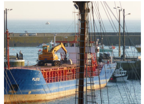
L'Union Pluto dans le port de Granville en 2014.

ces produits à des niveaux de qualité élevés.»